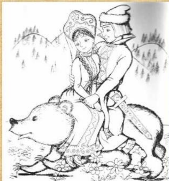
ИВАН-ЦАРЕВИЧ И СЕРЫЙ ВОЛК

«А лиса говорит: — Ах, песенка хороша, да слышу я плаха. Колобок, колобок, садь ко мне на носок да спой ещё разок. Колобок вскочил лисе на нос и запел погромче ту же песенку».