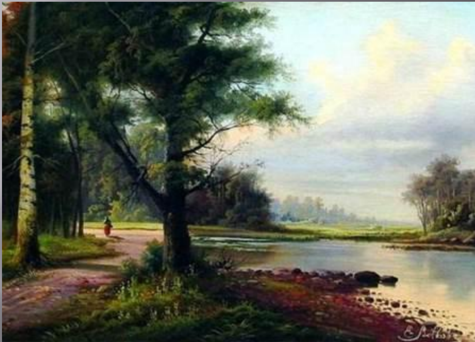
Волков Е.Е. «Пейзаж»