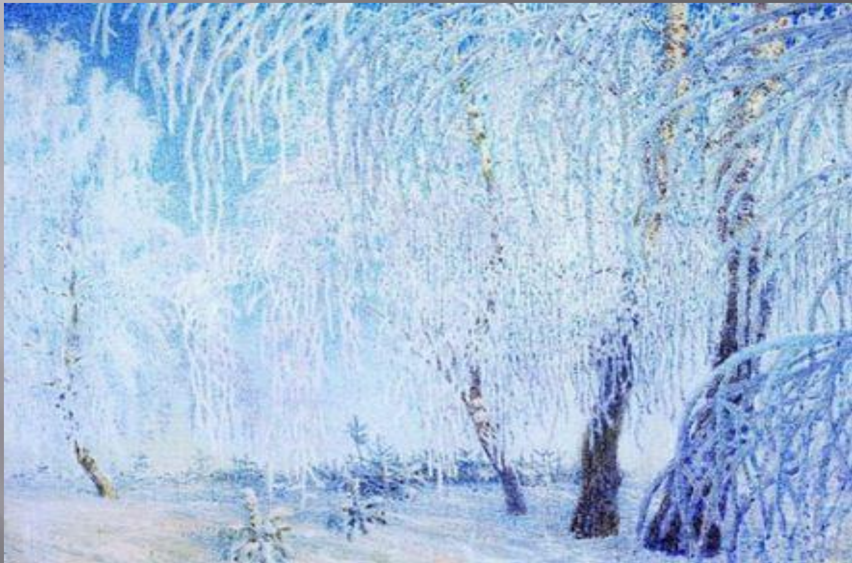
Грабарь И. «Иней»