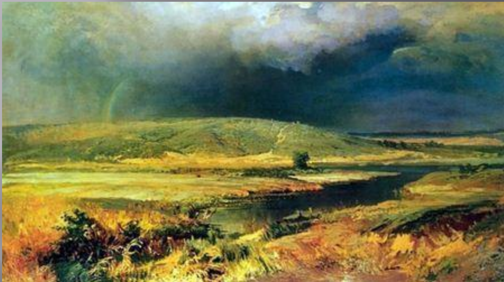
Васильев Ф.А. « Волжские лагуны»