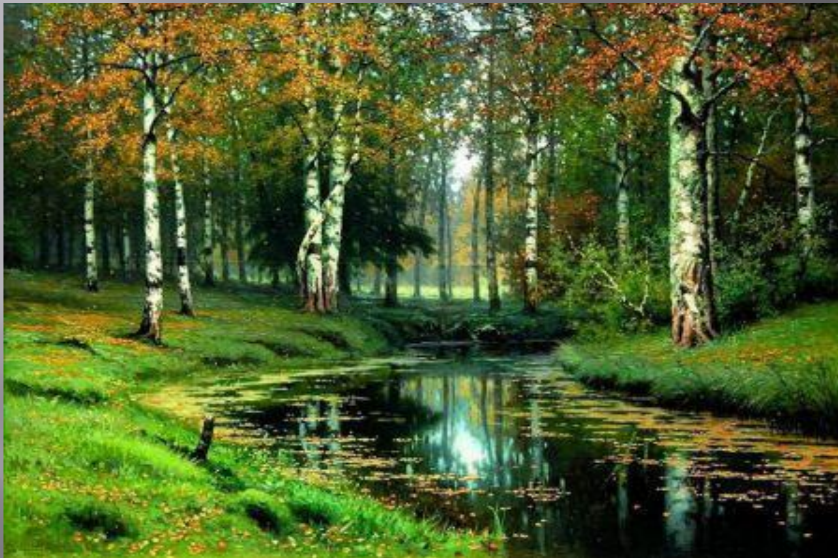
Волков Е.Е. «Золотая осень. Тихая речка»