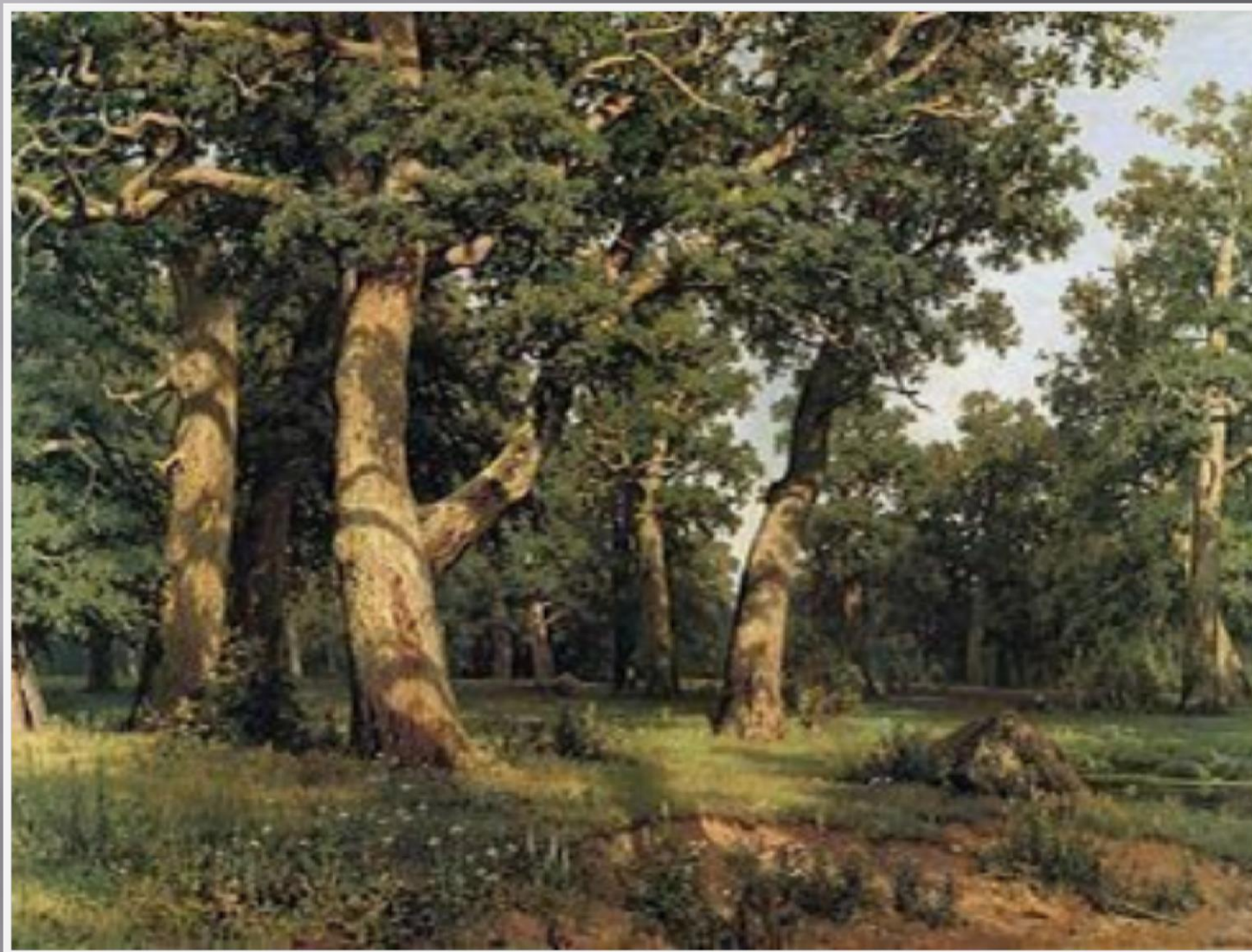
И.И. ШИШКИН «ДУБОВАЯ РОЩА»