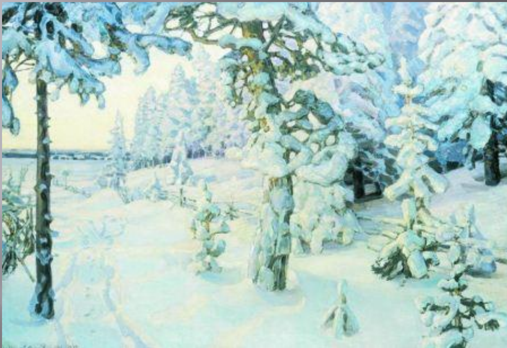
Васнецов А.М. «Зимний сон»