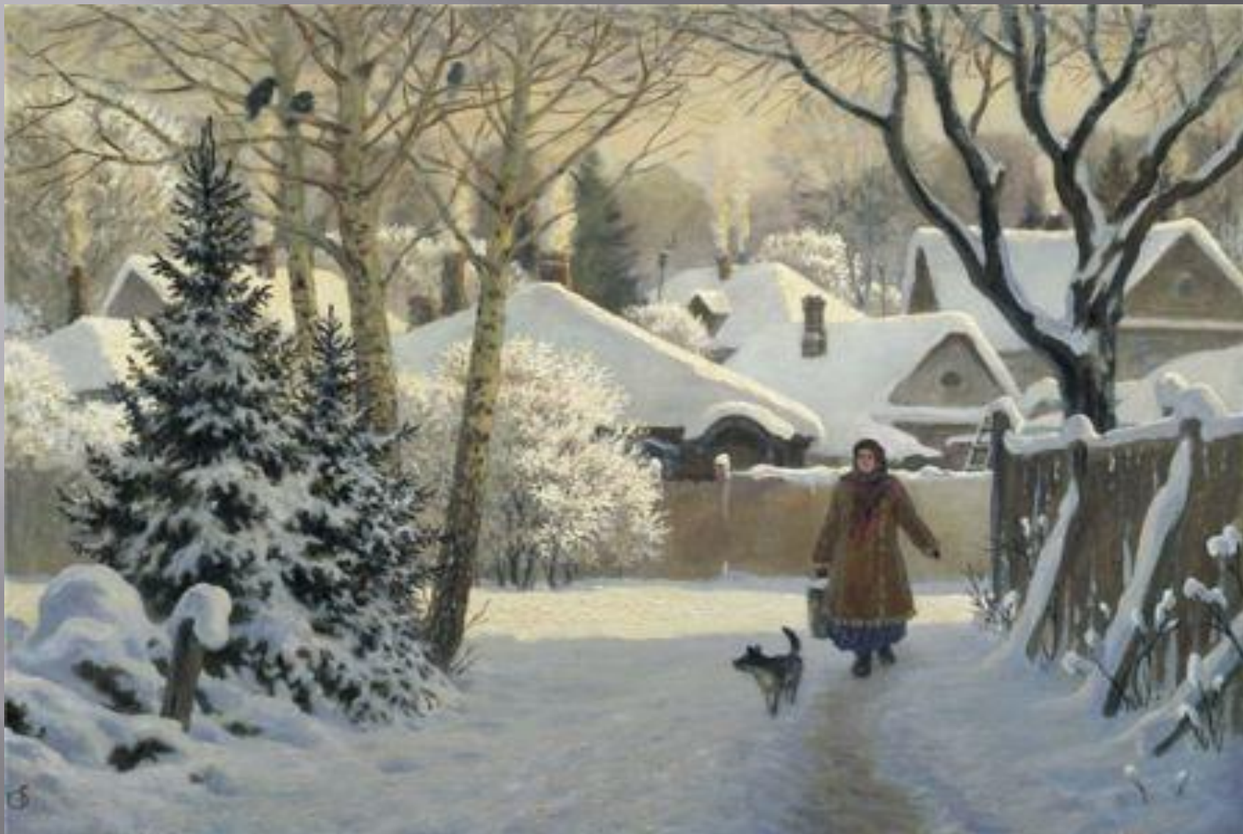
Куинджи А.И. «Зимний день»