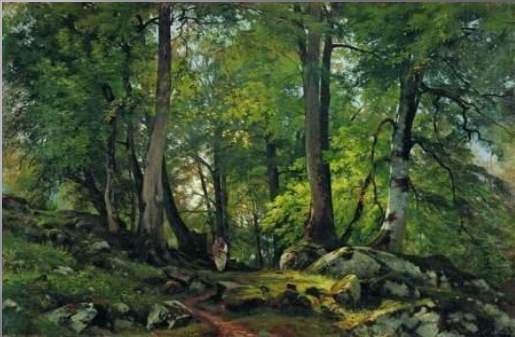
И.И. ШИШКИН «ЛЕС»