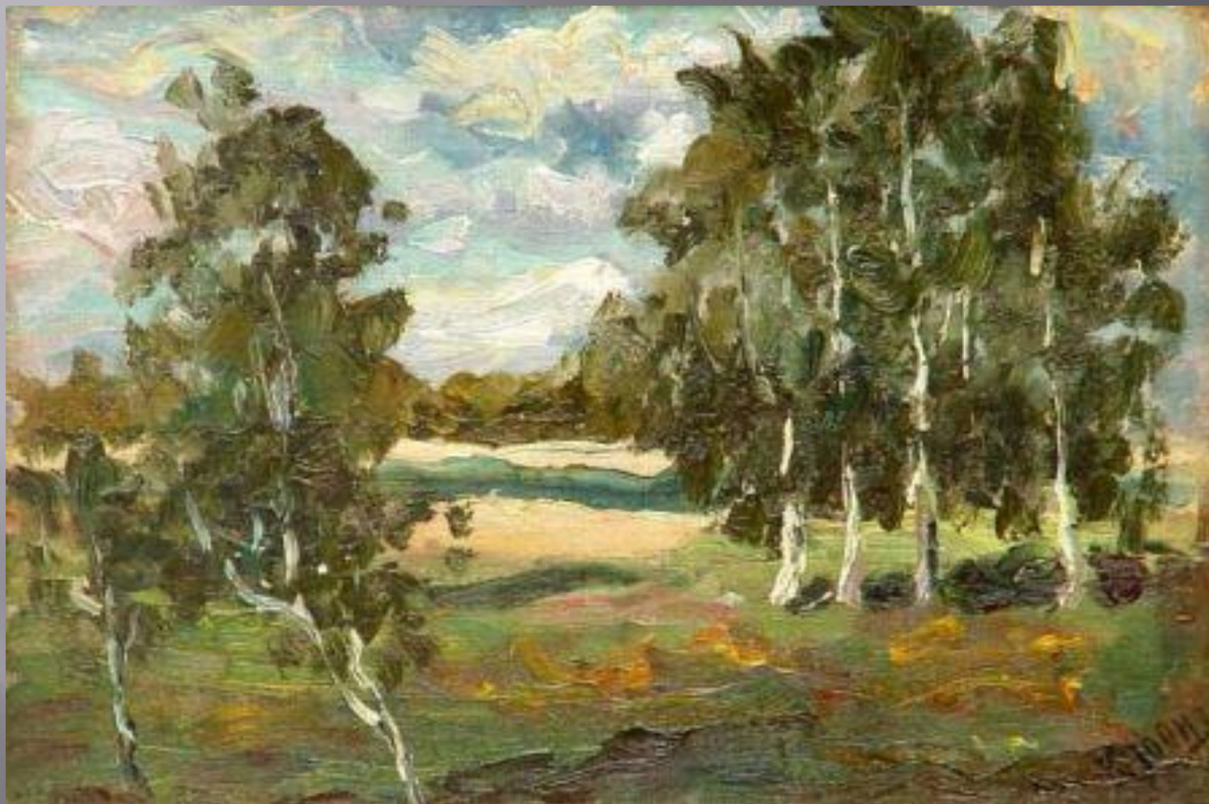
Юон к.ф. «пейзаж с березами»