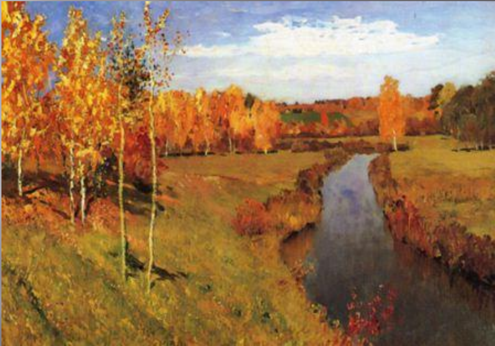
Ленвитан И.И. «Золотая осень»