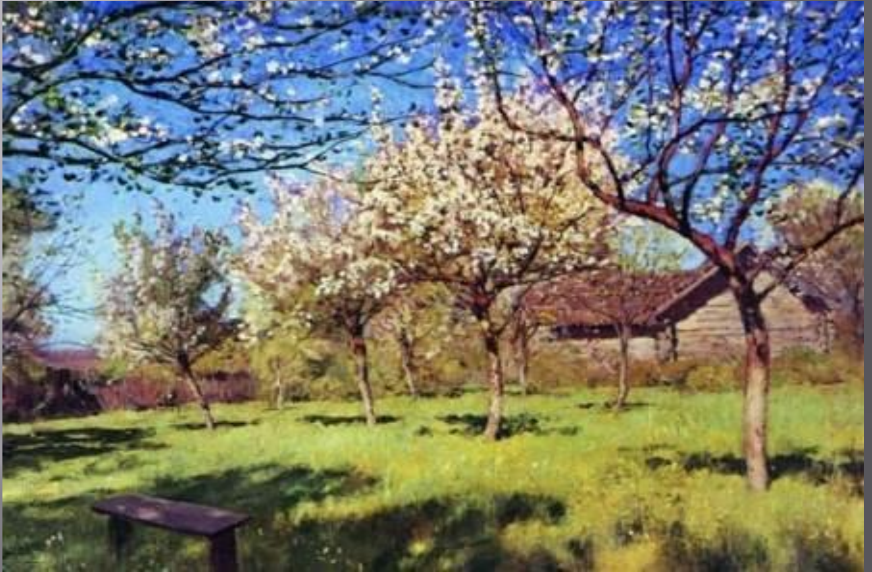
И.И.Левитан «Яблони цветут»