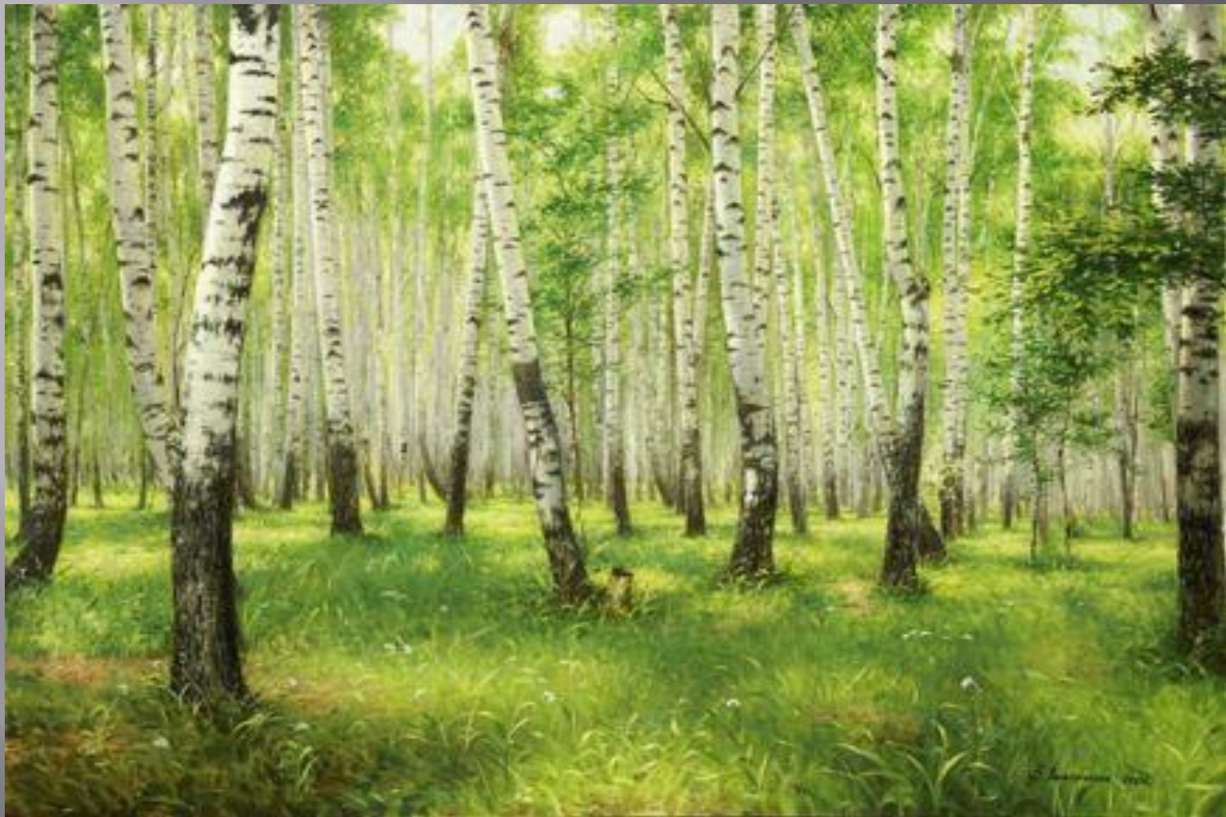
АЛЕКСАНДРОВ В.а. «Березовая роща»