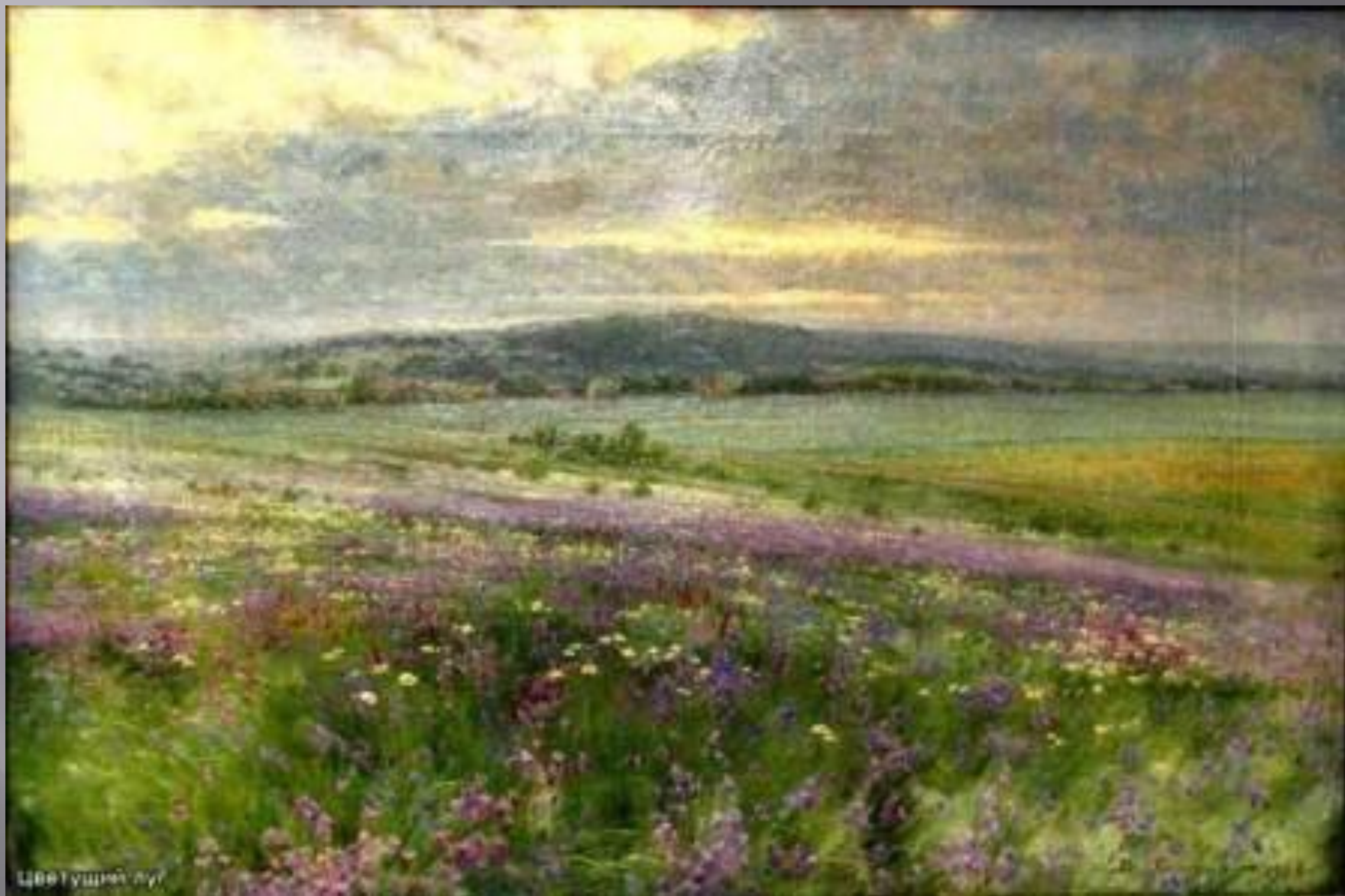
Батурин В.П. «Цветущий луг»