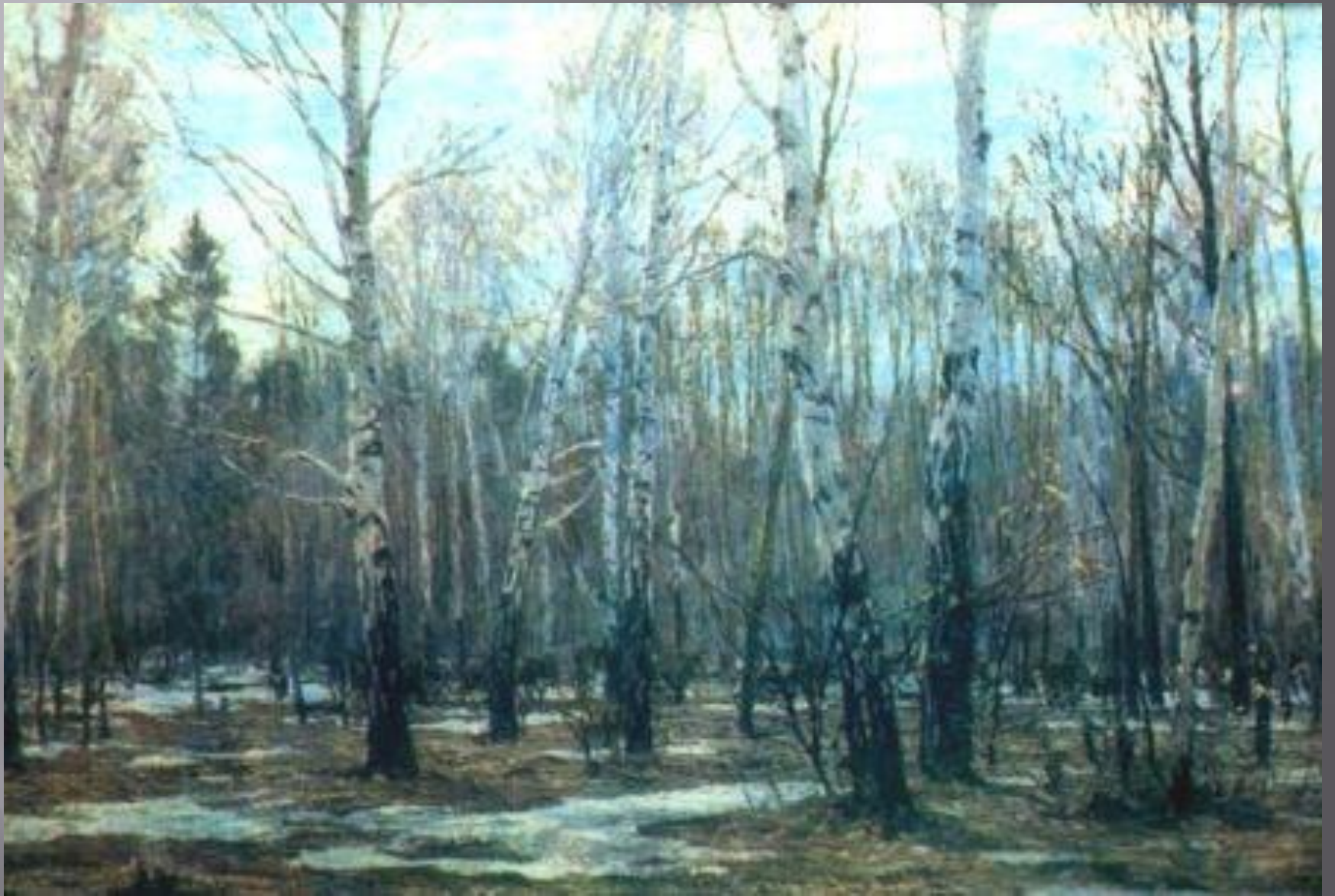
Грицай А. «Апрель в лесу»