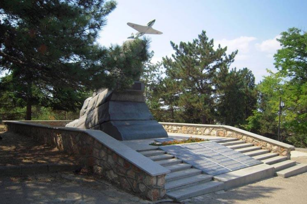
Памятник лётчикам на Малаховом кургане