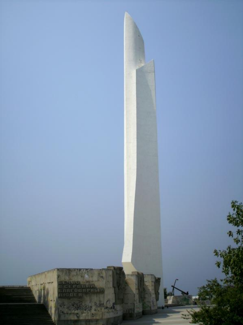
Обелиск «Штык-парус» в честь присвоения Севастополю звания «Город- герой»