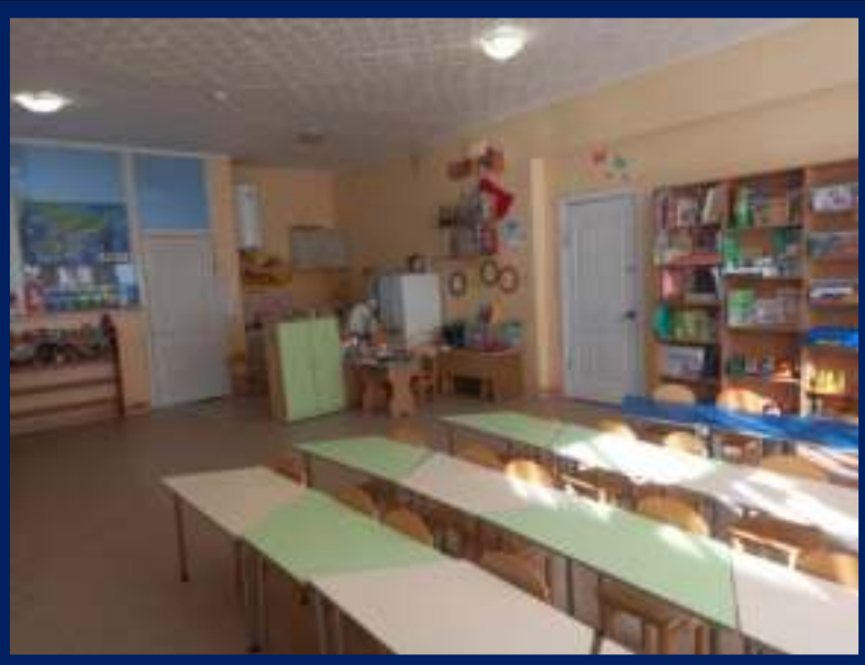
Группа «Подсолнух »

Раздевалка: шкаф для детской одежды - 35 секций, скамья для раздевания-2, шкаф для детской обуви – 1, дорожка ковровая – 1, информационный стенд для родителей, стенд для детских работ «Наше творчество»-1, панно для выставки детских работ, материалов (ступенчатая основа для выставки лепных работ и т.п.).