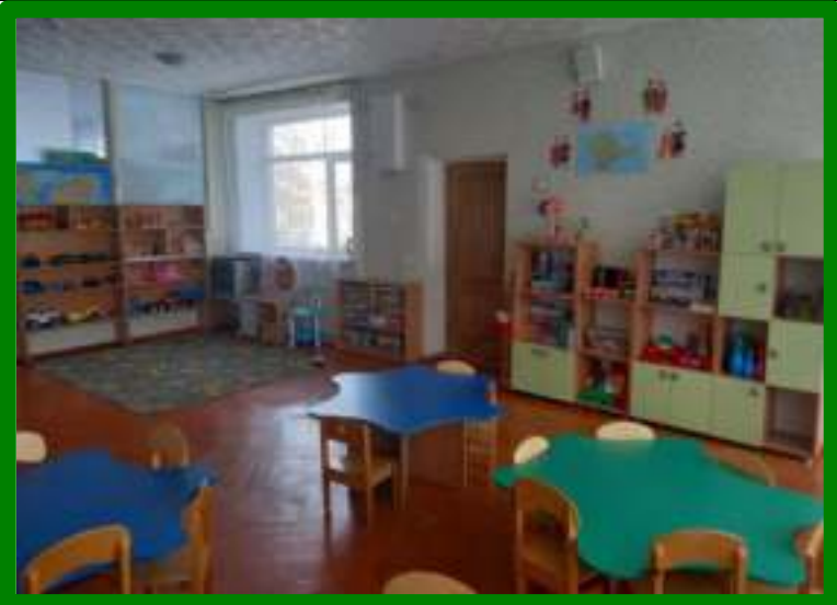
Группа «Солнышко »

Раздевалка: шкаф для детской одежды - 35 секций, скамья для раздевания-4, полка для детской обуви – 1, дорожка ковровая – 1, стенд для детских работ «Наше творчество»-1, панно для выставки детских работ, материалов (ступенчатая основа для выставки лепных работ и т.п.).