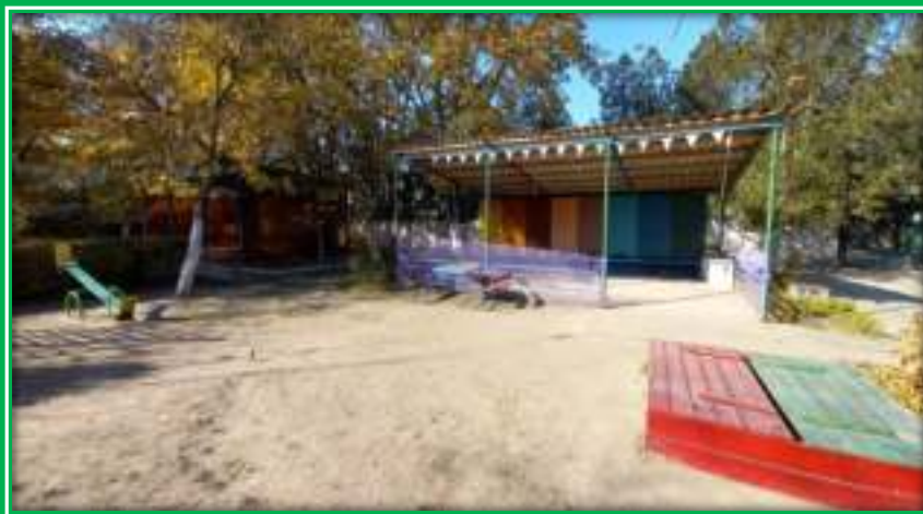
Прогулочная площадка группы «Солнышко»

Теневой навес - 1, песочница -1, карусель-1, двойной балансир «Лошадка»-2шт, лестница для лазания-1, лестница спортивная-1