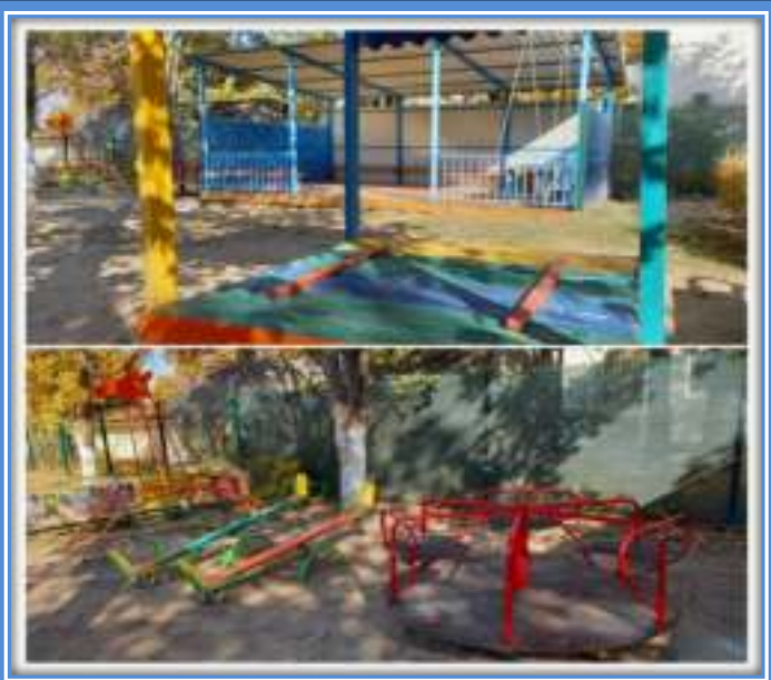
Прогулочная площадка группы «Крапелька»

Теневой навес - 1, песочница с крышей-1, карусель-1, балансир-качалка-2шт, лестница для лазания «Жираф»-1