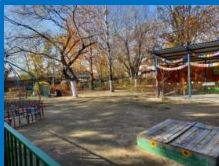
Прогулочная площадка группы «Гномики»

Теневой навес - 1, песочница -1, беседка металлическая-1