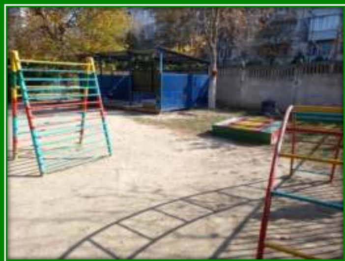
Прогулочная площадка группы «Фиданлар»

Теневой навес - 1, песочница с крышей-1, карусель-1, балансир-качалка-2шт, лестница для лазания «Жираф»-1