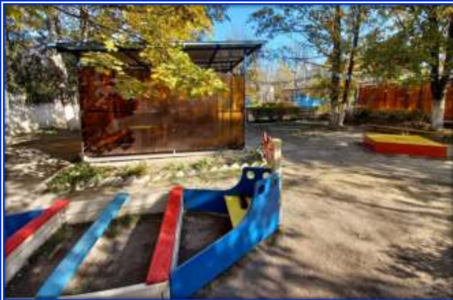
Прогулочная площадка группы «Сказка»

Теневой навес - 1, песочница-1, песочница-лодка-1, лестница для лазания