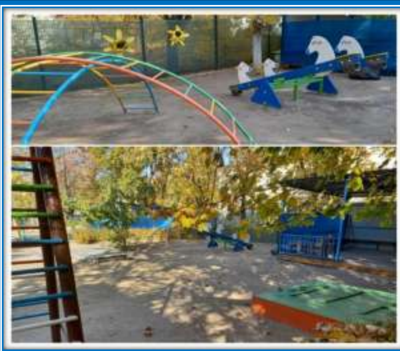
Прогулочная площадка группы «Подсолнух»

Теневой навес - 1, песочница -1, карусель-1, двойной балансир «Лошадка»-2шт, лестница для лазания-1, лестница спортивная-1