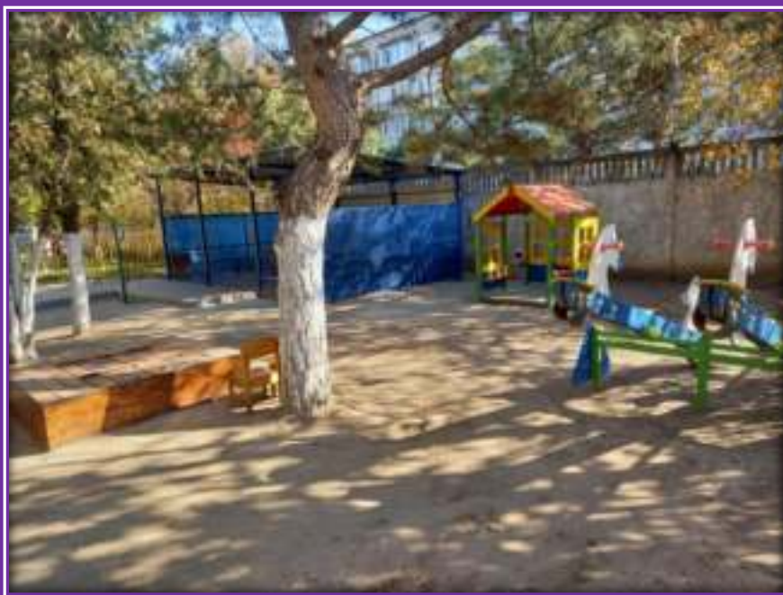
Прогулочная площадка группы «Севинч»

Теневой навес -1, игровой домик -1, песочница -1, горка «Лайм» -1, балансир двойной «Лошадка» -1