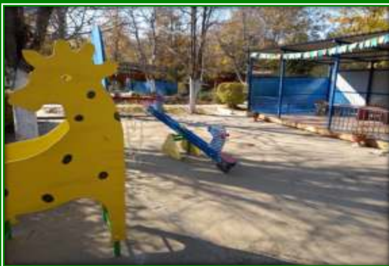
Прогулочная площадка группы «Крымуша»

Теневой навес - 1, песочница «Астра» - 1, песочница-1, лестница «Зигзаг»-1, столик игровой – 1, карусель – 1, балансир «Лошадка»-1, стойка баскетбольная «Жираф»-1