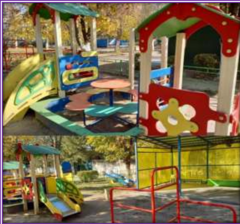
Прогулочная площадка группы «Лесная сказка»

Теневой навес - 1, песочница «Астра» - 1, песочница-1, лестница «Зигзаг»-1, столик игровой – 1, карусель – 1, балансир «Лошадка»-1, стойка баскетбольная «Жираф»-1