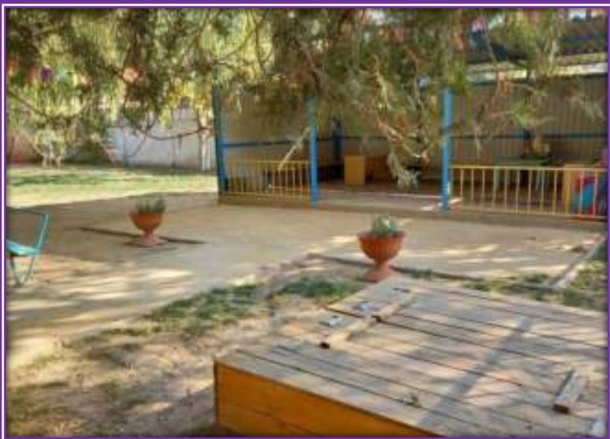
Прогулочная площадка группы «Радуга»

Теневой навес - 1, песочница-1, песочница-лодка-1, лестница для лазания