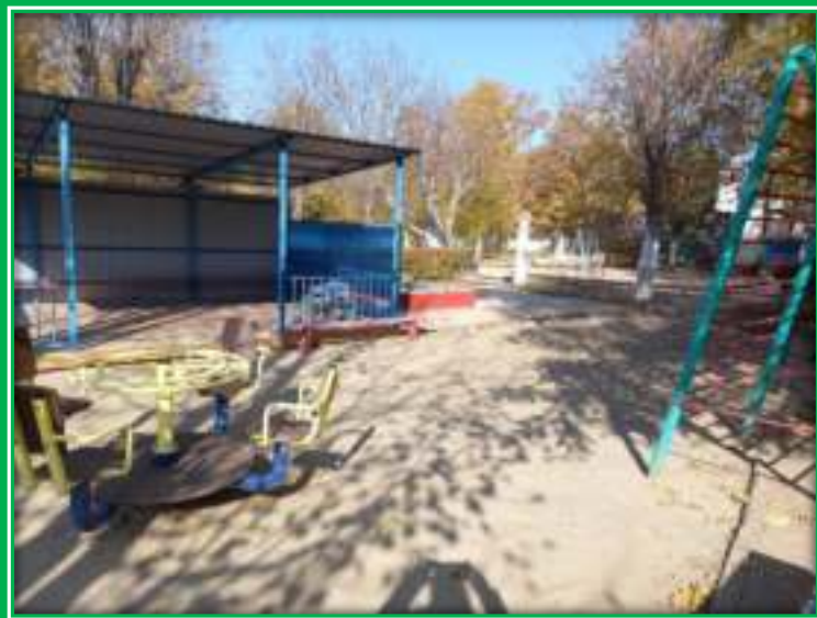
Прогулочная площадка группы «Теремок»

Теневой навес - 1, песочница -1, беседка металлическая-1